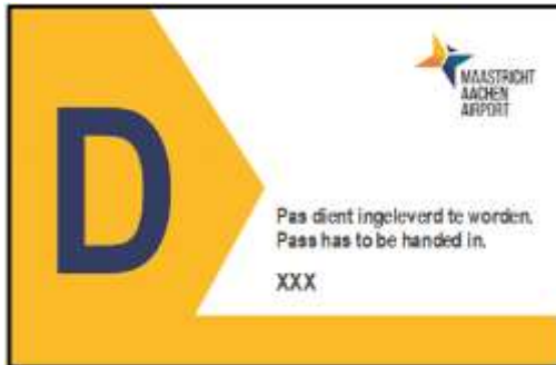
Figuur 2 dagpas Geeft enkel onder begeleiding toegang tot airside

Bezoekers hebben een dagpas die wordt uitgegeven door de beveiliging. Bezoekers mogen echter nooit zonder toezicht zijn op airside. Er wordt daarom altijd een begeleider genoteerd die verantwoordelijk is voor het gedrag van de bezoeker. Bezoekers mogen niet zomaar het terrein op, hier dient een geldige reden voor te zijn. Als je zelf een keer een bezoeker mee moet nemen op airside of andere beschermde gebieden dan kun je deze aanvragen via de afdeling Airport Operations middels het speciale formulier welke je op www.maa.nl kunt vinden.