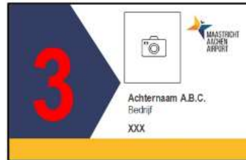
Figuur 1 pas met toegang tot zone 3 demarcated area. Met toestemming aanwezig te blijven bij calamiteiten (rood cijfer)