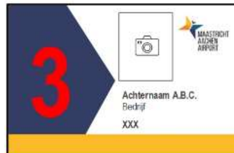
Figuur 1 pas met toegang tot zone 3 demarcated area. Met toestemming aanwezig te blijven bij calamiteiten (rood cijfer)